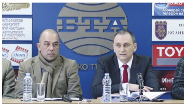
Червените общински съветници внасят 13 предложения в инвестиционната програма.